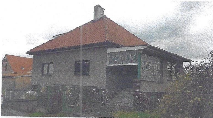
Pohled ze zahrady